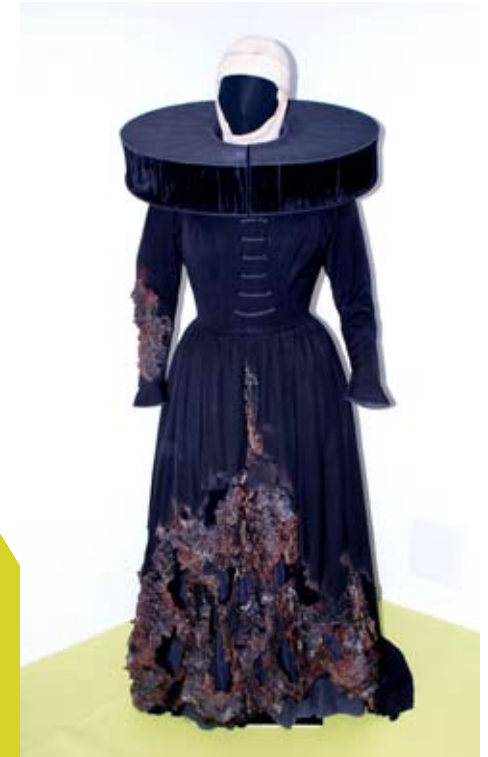
Costume pour une sorcière Portrait de Johannes Wtenbogaert, 1633, La Tragédie de Macbeth Pièce de William Shakespeare Mise en scène Jean-Pierre Vincent Costumes d'après Thierry Mugler Comédie Française, 1985