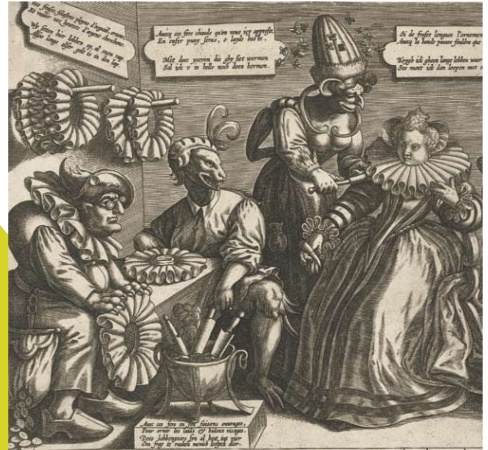
Détail, gravure satirique, anonyme, d'après un dessin de Maerten de Vos, 1600-1625, Rijksmuseum, Amsterdam.

Pour un prochain spectacle, les lingères de la Comédie française vont devoir créer une nouvelle fraise. A cette occasion, un second film consacré à l'ensemble des étapes de la fabrication sera intégré à l'exposition itinérante.