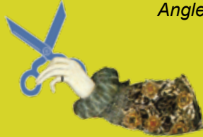
Ermine portrait, Elisabeth I ère d'Angleterre Nicholas Hilliard, 1585, Hatfield House, Angleterre.