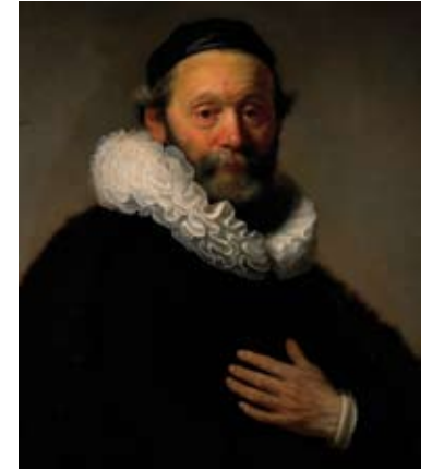
Portrait de Johannes Wtenbogaert, 1633, Rembrandt, Rijksmuseum, Amsterdam, Pays-Bas.

Un dernier type de fraise apparaît en France et se développe dès la fin du règne d'Henri III (1574-1589) et au début du XVIIe siècle : c'est la fraise à la confusion, appelée ainsi parce que ses rangs se superposent de façon désordonnée.