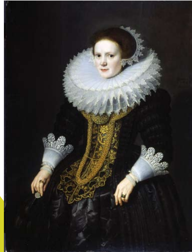
Peintre établi à Utrecht, Miereveld avait pour clients les membres de la haute bourgeoisie et de la noblesse, pour lesquels il élabore un type de représentation stéréotypée (figure de trois-quarts, coupée aux genoux, sur fond sombre). Le peintre rend avec un grand raffinement, par un jeu de clair-obscur, les godrons et les jours de l'imposante fraise en dentelle, les plis façonnés du manteau, les reflets du corsage de brocart gris-vert.

A l'occasion de cette exposition, le Musée des Beaux-Arts de Lyon prête au Musée des Manufactures de Dentelles un chef-d'oeuvre «Portrait de femme» daté de 1625 peint par Michel Jansz Van Miereveld.