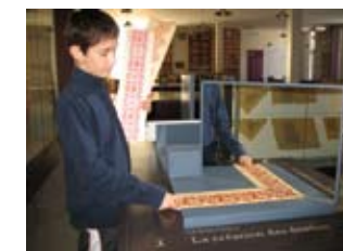
Musée - grand atelier 1