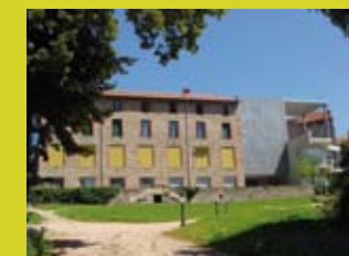
Musée côté parc