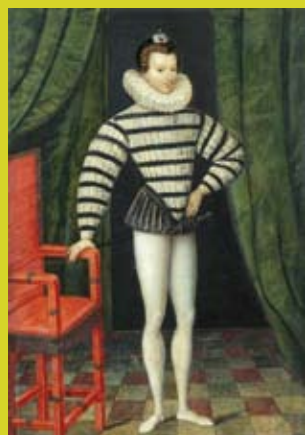
Le Marquis de Saint Mégrin, Paul Stuer de Caussade, Musée du Louvre, Paris, © RMN - © Gérard Blot.