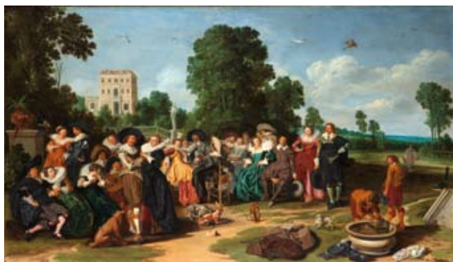
La Fête Champêtre, Dirck Hals, 1627, Rijksmuseum, Amsterdam.

Téléchargeables sur le site www.ville-retournac.fr/musee/presse.html