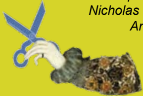
Ermine portrait, Elisabeth I ère d'Angleterre Nicholas Hilliard, 1585, Hatfield House, Angleterre.