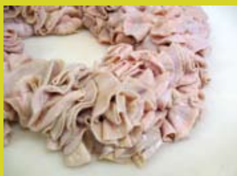
Fraise de veau, © Musée des Manufactures de Dentelles.