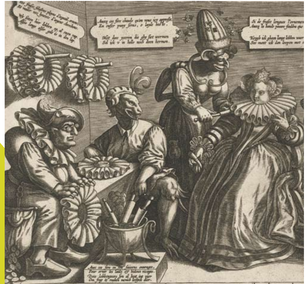
Détail, gravure satirique, anonyme, d'après un dessin de Maerten de Vos, 1600-1625, Rijksmuseum, Amsterdam.