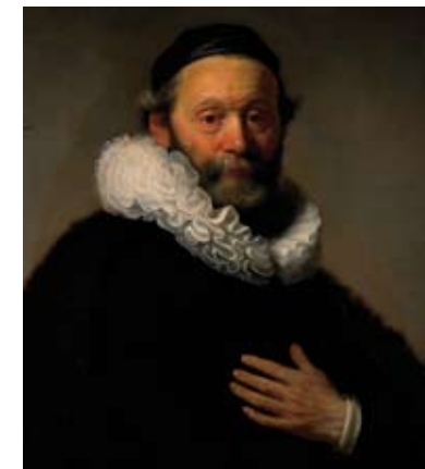
Portrait de Johannes Wtenbogaert, 1633, Rembrandt, Rijksmuseum, Amsterdam, Pays-Bas.

Un dernier type de fraise apparaît en France et se développe dès la fin du règne d'Henri III (1574-1589) et au début du XVIIe siècle : c'est la fraise à la confusion, appelée ainsi parce que ses rangs se superposent de façon désordonnée.