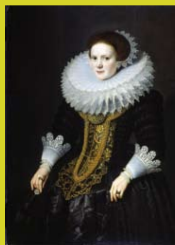
Portrait de femme, huile sur bois, Michel Jansz Van Miereveld, 1625. Prêt du Musée des Beaux-Arts de Lyon, © MBA Lyon / Alain Basset.