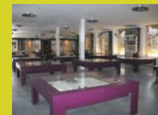
Musée - grand atelier 2