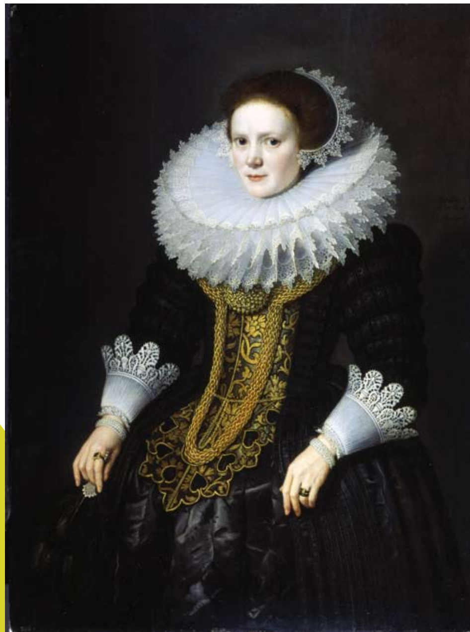
Portrait de femme, huile sur bois, Michel Jansz Van Miereveld, 1625. Prêt du Musée des Beaux-Arts de Lyon

A l'occasion de cette exposition, le Musée des Beaux-Arts de Lyon prête au Musée des Manufactures de Dentelles un chef-d'oeuvre daté de 1625 peint par Michel Jansz Van Miereveld. Le Musée des Beaux-Arts de Lyon effectue le convoiement du tableau qui prendra place au sein de l'exposition Fraises - cols extravagants au sein d'une vitrine spécialement conçue pour le recevoir.