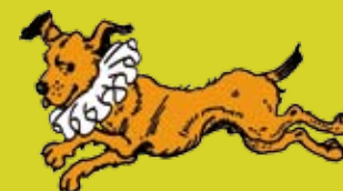
La fraise du chien