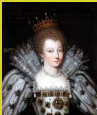
Marie Stuart, 1587, anonyme, Musée Louis-Philippe, Château d'Eu, © Paul Dubois.