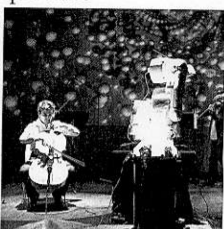
De gauche à droite : Projections et spectacle équestre au Musée du château Saint-Jean à Nogent-le-Rotrou en Eure-et-Loir. Parcours orientaliste au Musée d'Orsay, Esclave d'amour et lumière des yeux : Abd-el-Gheram et Nouriel-Ain, légende arabe d'Étienne Dinet. Concerts et réinterprétations d'œuvres électro ou classiques sous la direction d'un robot chef d'orchestre à la Cité des sciences et de l'industrie de Paris. Minuit, H. Leoussieux/FOAN et DR

Top chrono : notre sélection d'animations gratuites.